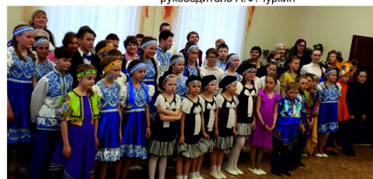
Учащиеся и преподаватели ДШИ